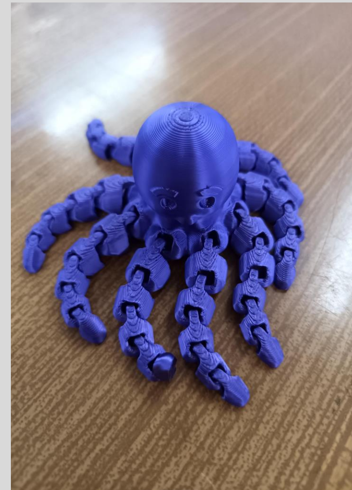
Selbst gemachtes Fidget-Toy