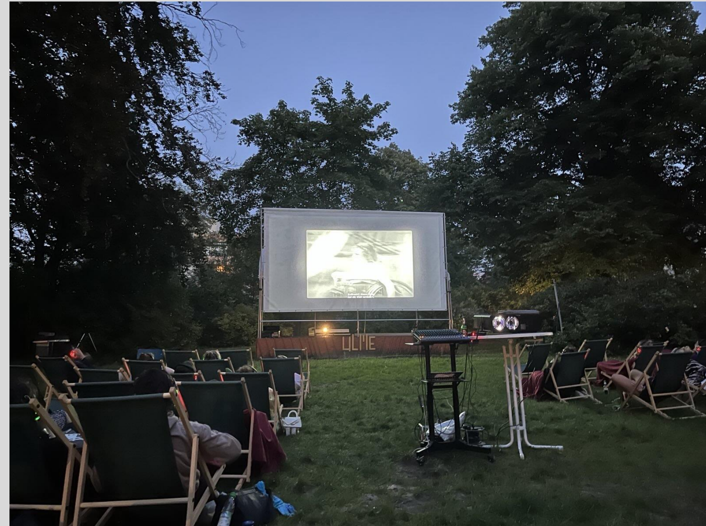
Foto vom 2. barrierearmen Freiluftkino