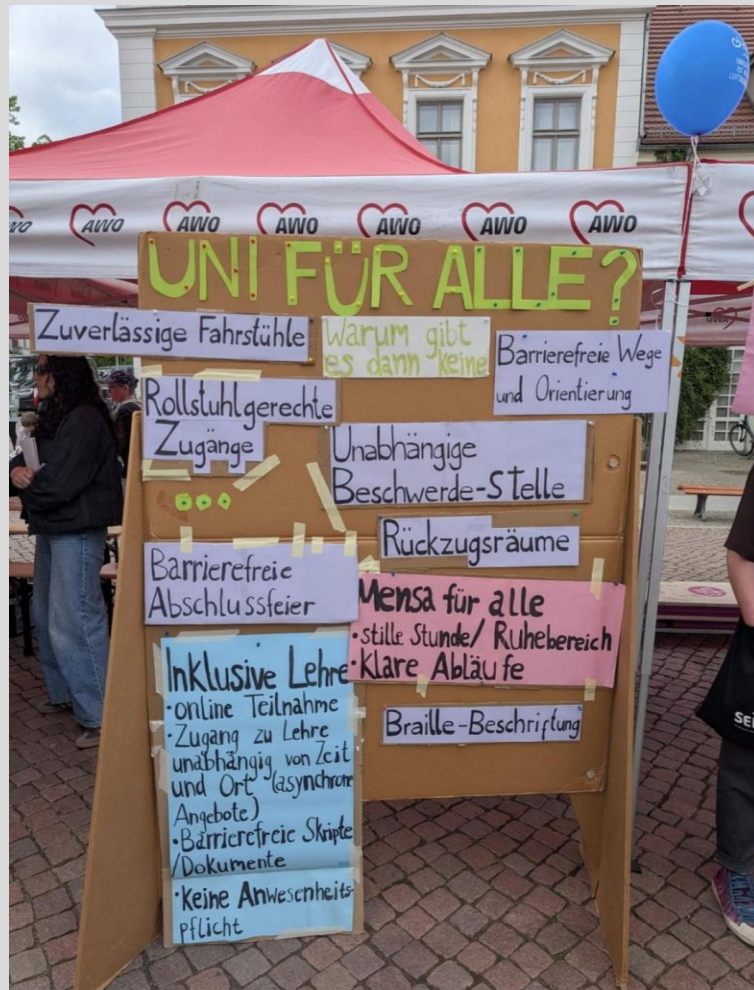
Protestaktion zum 5. Mai