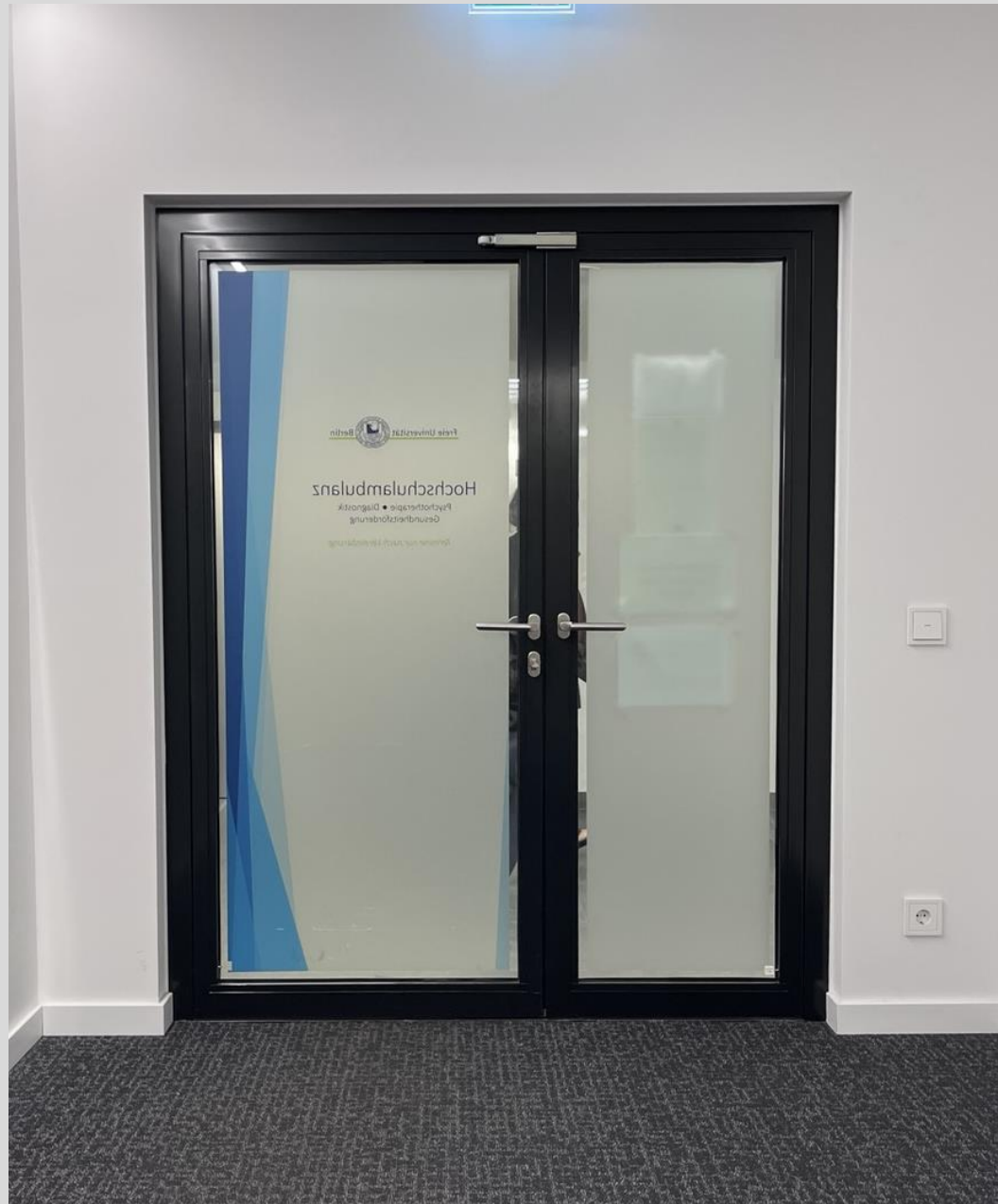
Die Pavlov'sche Tür